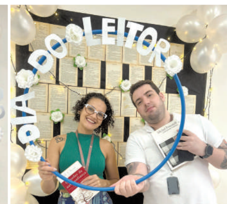
Um espaço para associados e dependentes

mento integral dos comerciantes e de suas comunidades.