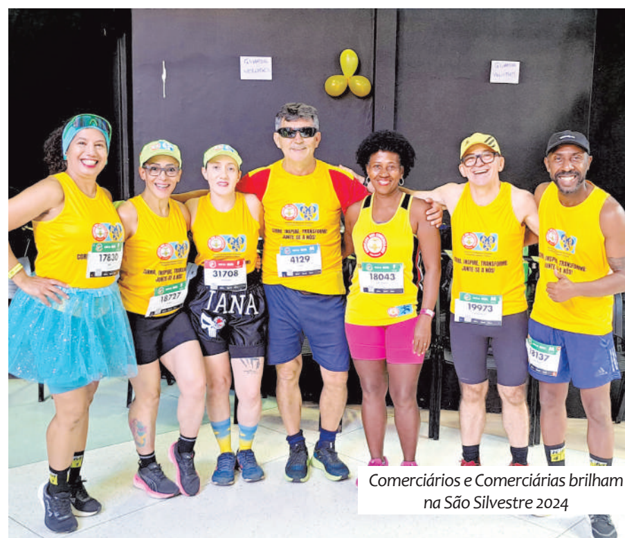
Comerciantes e Comerciantes brilham na São Silvestre 2024

Os 17 representantes do Sindicato enfrentaram os 15 quilômetros do percurso com determinação e espírito esportivo, conquistando mais do que resultados: levaram consigo o orgulho de representar os comerciantes em um evento de grande visibilidade.