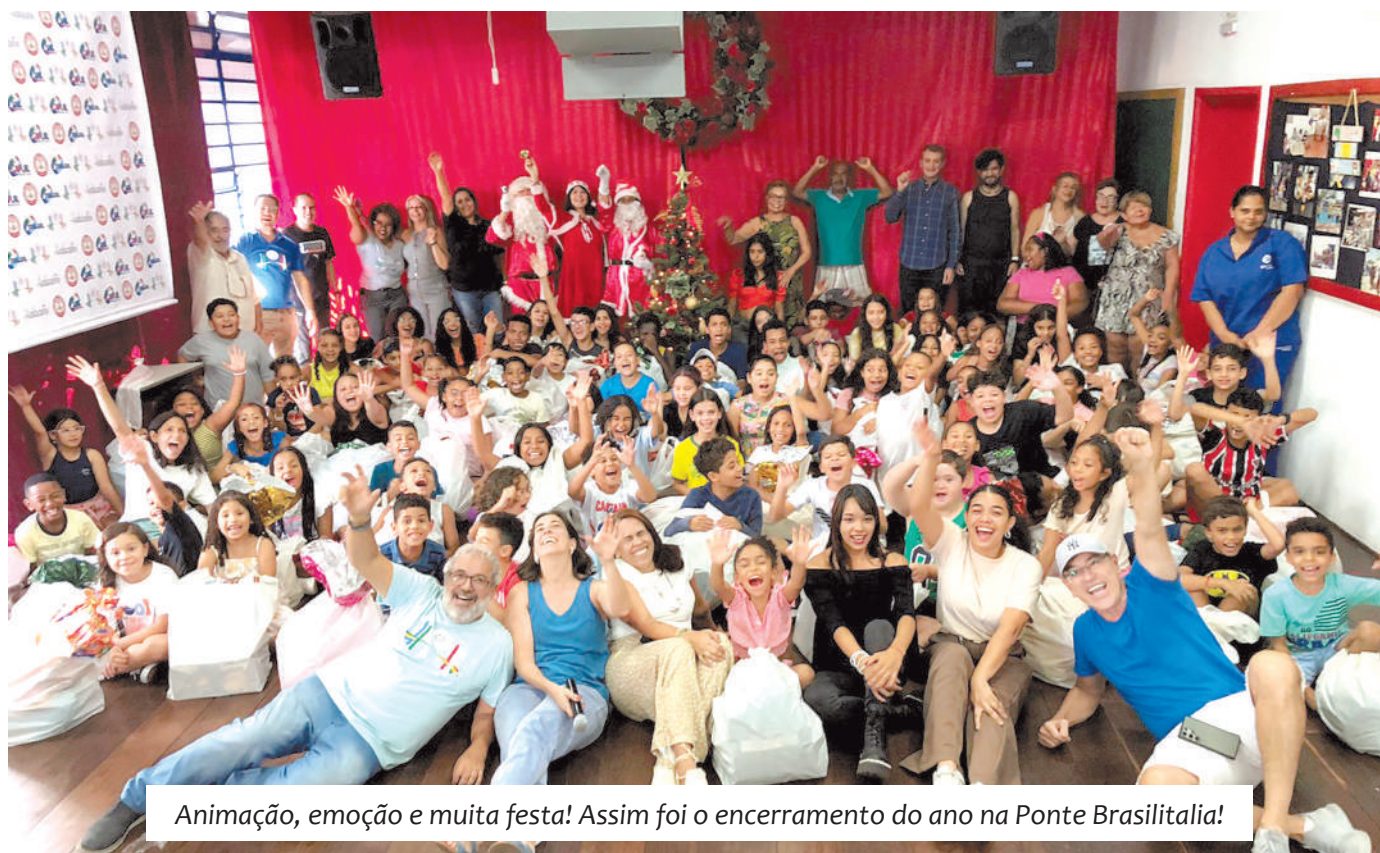
Animação, emoção e muita festa! Assim foi o encerramento do ano na Ponte Brasilitalia!