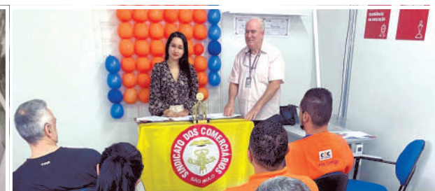
Reunião na C&C para garantir benefícios adicionais a trabalhadores dispensados.