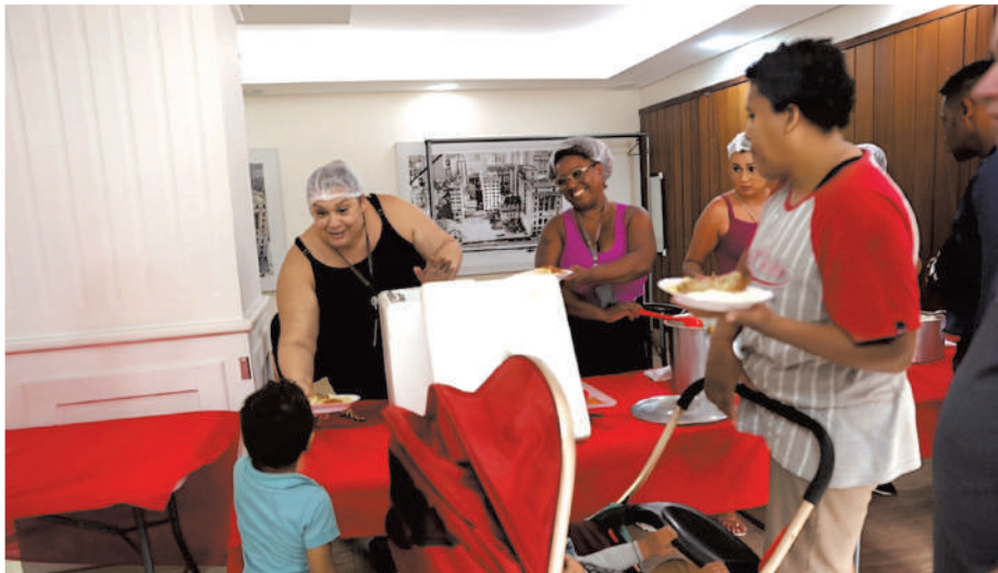
SECSP abre as portas da sua sede para realizar almoço solidário