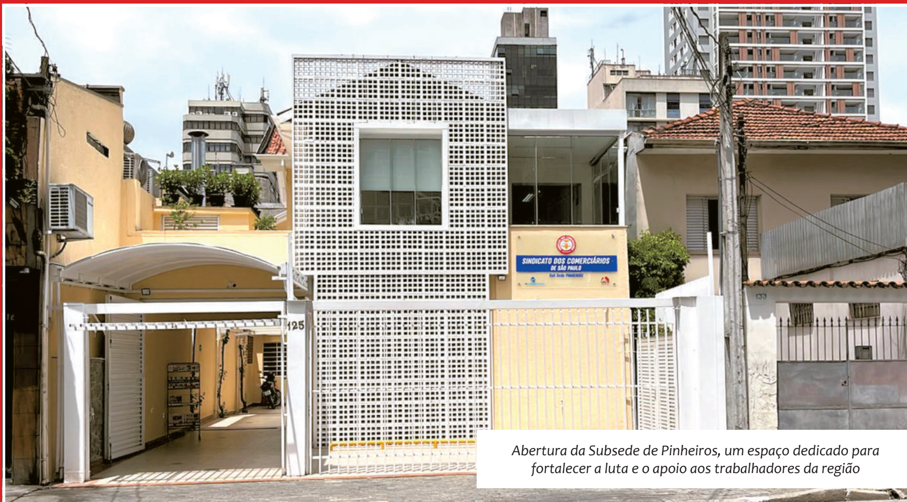
Abertura da Subsede de Pinheiros, um espaço dedicado para fortalecer a luta e o apoio aos trabalhadores da região

O Sindicato dos Comerciantes de SP iniciou o ano de 2025 com a Subsede de Pinheiros reabriu suas portas após uma ampla reforma, oferecendo modernos serviços de saúde e atendimento de excelência aos comerciantes e comerciantes da Zona Oeste de São Paulo. Localizada na rua Lacerda Franco, 125, a unidade comemora 43 anos de história em fevereiro e agora conta com consultórios de dentistas, clínico geral, ginecologistas e nutricionistas.