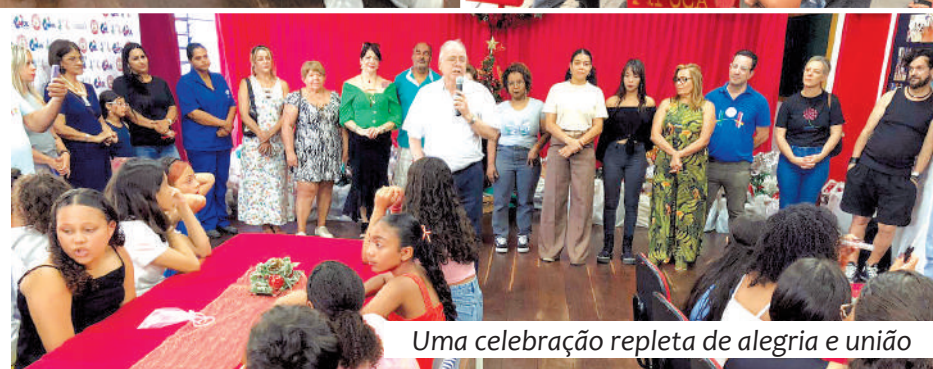
Uma celebração repleta de alegria e união

Com o compromisso de promover acolhimento e oportunidades, a Ponte Brasilitália reafirma sua missão de construir pontes de solidariedade e inclusão. A festa de Natal foi mais um momento de união, deixando claro que, mesmo diante das adversidades, é possível levar esperança e transformar vidas.