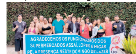
Momento de lazer e descontração promovido pelo Sindicato.

zados pelo Campana Laboratório de Análises Clínicas ou a+ Medicina Diagnóstica, ambos do renomado Grupo Fleury, garantindo qualidade e precisão nos diagnósticos.