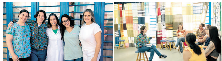
Graças a ação e a dedicação dos (as) voluntários (as), a ponte Brasilitália pode promover um evento voltado ao bem-estar e a saúde da comunidade do Rio Pequeno