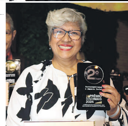
Reconhecimento de Excelência: UGT recebe o prêmio no evento Sindimais pela realização do Mutirão de Emprego, destacando-se pelo compromisso com a geração de oportunidades e inclusão social

sido realizado regularmente desde 2016 no Vale do Anhangabaú, em São Paulo. Este projeto conta também com a colaboração de outros sindicatos, como o Siemaco, o Sindicato dos Padeiros e o Sindicato de Cargas Próprias. O objetivo principal é proporcionar oportunidades reais de emprego e facilitar a recolocação de pessoas no mercado de trabalho, promovendo assim a inclusão social.