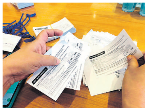
Apuração dos votos e contagem das cédulas