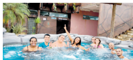
Comerciários (as) relaxando nas águas quentes do Parque Aquático

Apesar do tempo frio, os trabalhadores e as trabalhadoras aproveitaram as piscinas e o evento foi bastante proveitoso. Os participantes puderam conhecer melhor a estrutura do Parque e entender um pouco mais sobre os benefícios que o Sindicato oferece para toda a categoria.