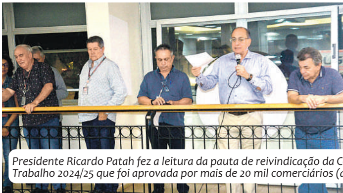
Presidente Ricardo Patah fez a leitura da pauta de reivindicação da Convenção Coletiva de Trabalho 2024/25 que foi aprovada por mais de 20 mil comerciários (as)

Em 18 de junho, a sede do Sindicato dos Comerciários de São Paulo, localizada na região central da cidade, foi palco da assembleia de apuração dos votos referentes à pauta de reivindicação da Convenção Coletiva de Trabalho 2024/2025. O evento marcou o encerramento do processo de votação iniciado há 15 dias e contou com a expressiva participação de aproximadamente 20 mil trabalhadores e trabalhadoras do setor, que demonstraram grande interesse e mobilização em relação às propostas apresentadas.