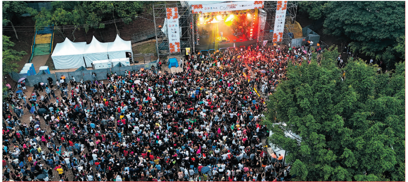
Cerca de 25 mil pessoas participaram do Mulher Comvida, foram atendidas nos serviços sociais e assistiram gratuitamente aos shows

“A luta trabalhista não se restringe apenas a questões salariais e benefícios, mas também engloba a defesa dos direitos fundamentais das trabalhadoras, como a proteção contra a violência de gênero”, disse Patah, que completou: “Nes-