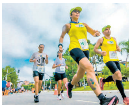
O SECSP promovendo saúde e união por meio do esporte