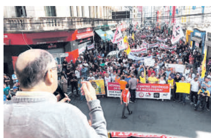
Manifestações pela revitalização do centro histórico de São Paulo - 2023