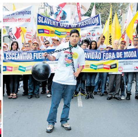
Manifestação, na Oscar Freire, Contra o trabalho escravo 25/08/2011