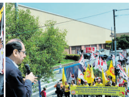
Ato Sindical em prol da segurança no trabalho