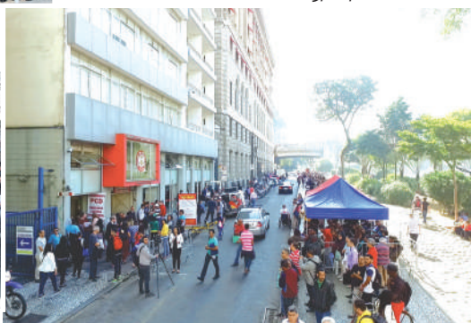
Mutirão de emprego, vaga social 16/07/2018