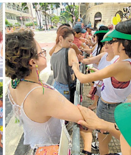
Respeito, segurança e consentimento foram temas abordados durante o carnaval