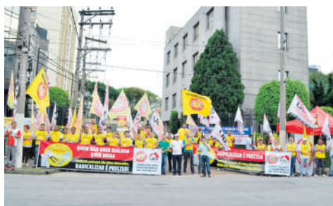
Mobilizações da Campanha Salarial 2013/2014

Os sindicatos muitas vezes participam ativamente das discussões e negociações sobre essas políticas, buscando assegurar que os trabalhadores sejam justamente remunerados e que seus salários acompanhem o crescimento econômico do país.