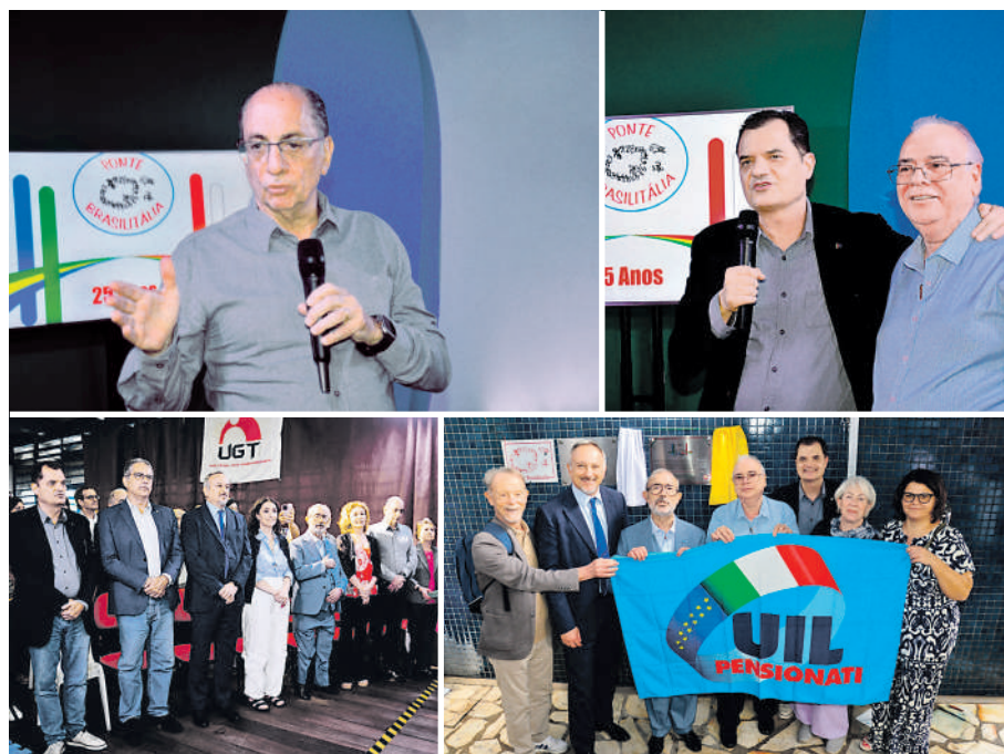
Comitiva italiana, parlamentares e sindicalistas brasileiros participaram da cerimônia