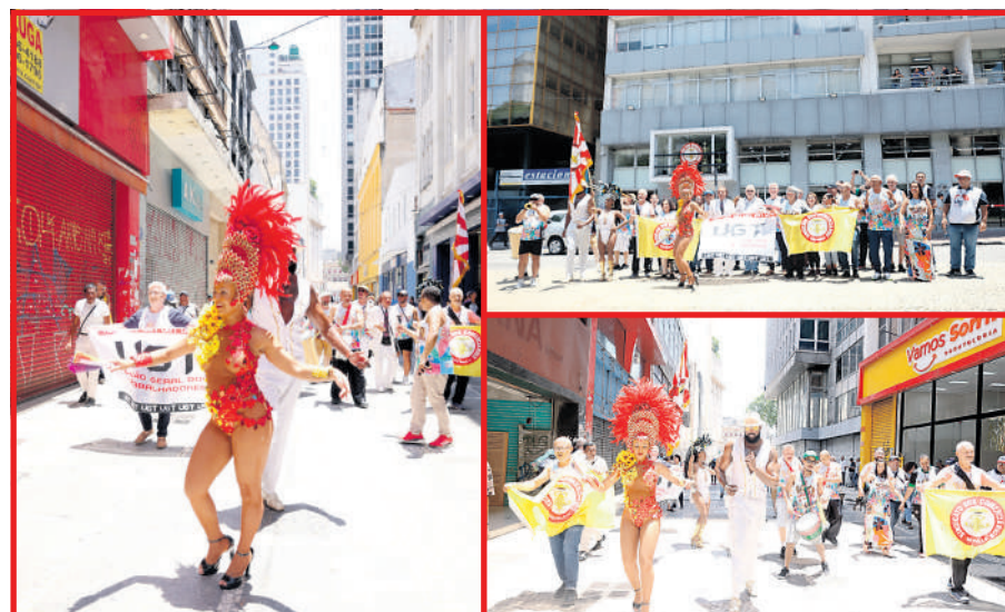
Diversão, saúde e responsabilidade foram as mensagens transmitidas pelo sindicato

A iniciativa reflete o engajamento dos trabalhadores e do sindicato em promover um Carnaval mais seguro e saudável para todos os foliões.