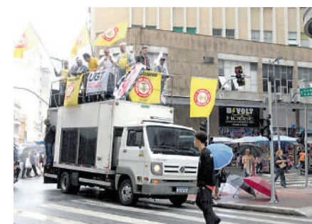
Ação do sindicato chama atenção para grave situação do fornecimento de energia elétrica na região

a persistência do problema pode gerar consequências drásticas como fechamento de lojas e demissões. “E quem paga essa conta que tem um forte peso político, econômico para a cidade de São Paulo e, acima de tudo, social com a demissão de pais e mães, arrimos de família”, concluiu.