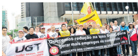
Manifestação em Frente ao Banco Central pela redução da Taxa Selic