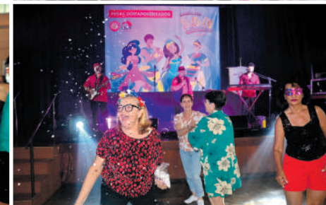
Alegria tomou conta dos(as) participantes que foram embalados pelas clássicas marchinhas de carnaval