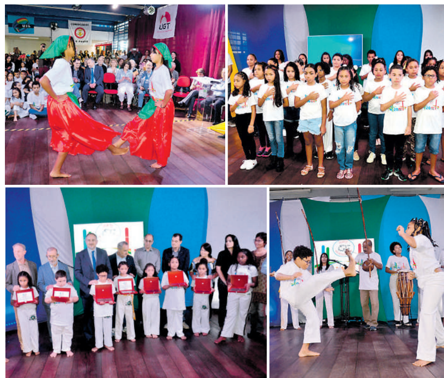
Crianças atendidas pelo projeto fizeram apresentação cultural de dança, capoeira e canto para os participantes