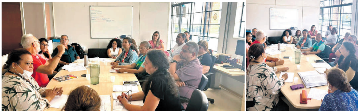
Em meio a luta incansável por condições de trabalhos justas o debate sobre saúde mental emerge como uma questão primordial