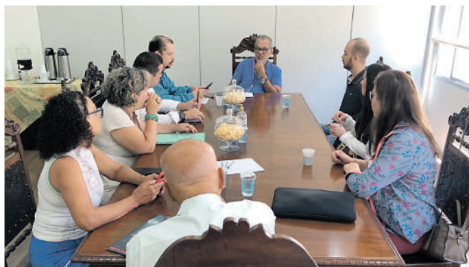
Vitória sindical em prol dos trabalhadores: Em um encontro decisivo, o SECSP garante compromisso das Casas Bahia para resolver pendências salariais