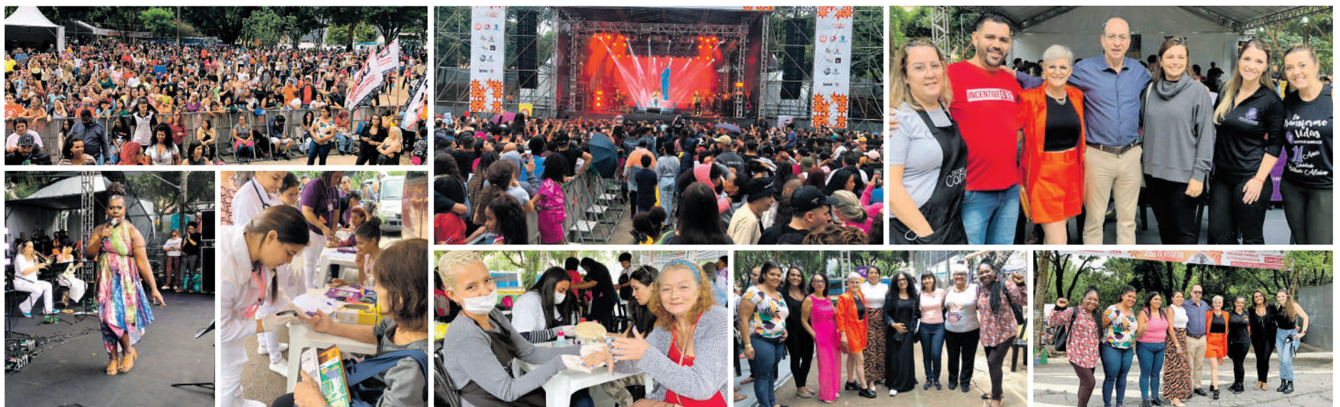
Artur Alvim foi palco de evento em homenagem ao mês das mulheres que já se tornou tradição na cidade de São Paulo