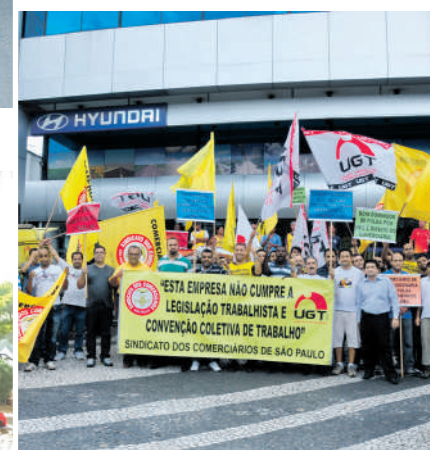
Manifestação em frente as concessionárias para que fosse respeitada a convenção coletiva de trabalho 04/03/2012